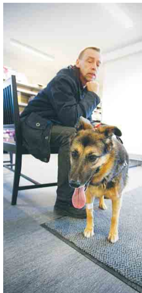
En patient i väntrummet väntar på sin tur.