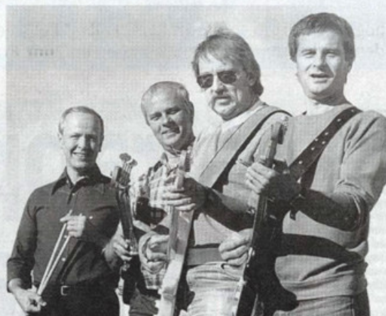
Gruppen Black Jacks återförenades 1983 och spelade in några låtar.